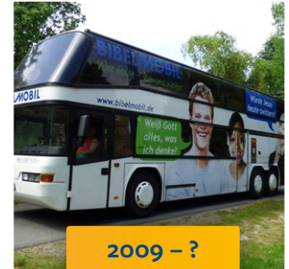
2009 – ? Neoplan