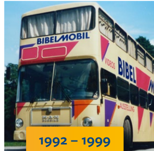
1992 – 1999 brauner MAN