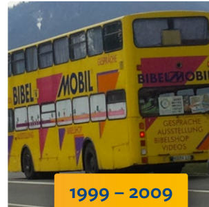
1999 – 2009 gelber MAN